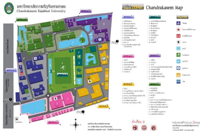
แผนภาพแสดงแผนที่มหาวิทยาลัยราชภัฏจันทรเกษม และอาคารที่ตั้งสำนักส่งเสริมวิชาการและงานทะเบียน สำนักส่งเสริมวิชาการและงานทะเบียน ตั้งอยู่ ณ ชั้น 2 อาคารสำนักงานอธิการบดี

ที่ตั้ง แผนที่มหาวิทยาลัยราชภัฏจันทรเกษมและอาคารที่ตั้ง สำนักส่งเสริมวิชาการและงานทะเบียน